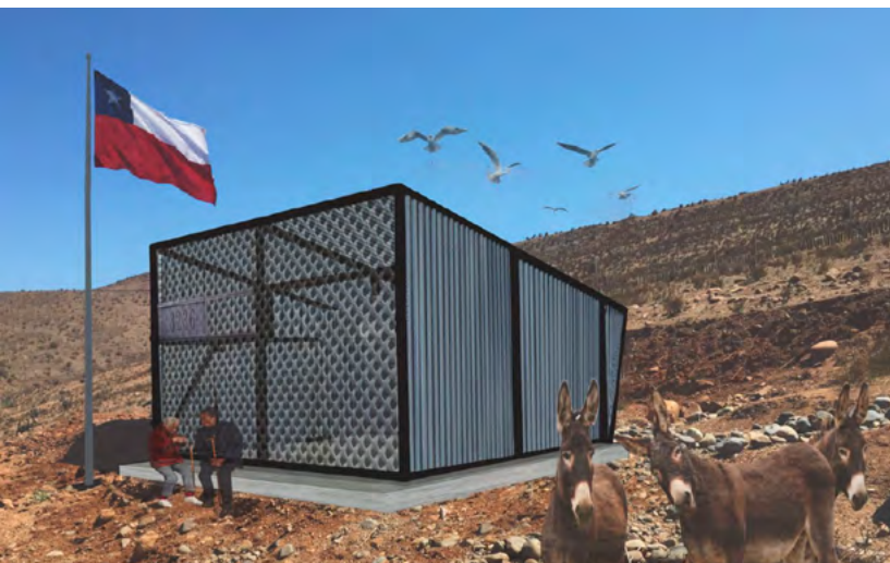
Imagen referencial del proyecto