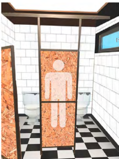
Imagen referencial del proyecto