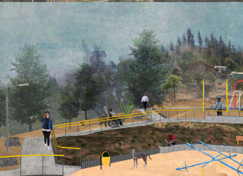
Imágenes referenciales del proyecto