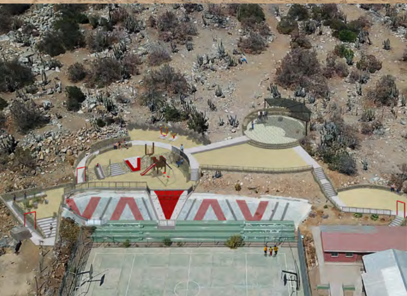
Imágenes referenciales del proyecto