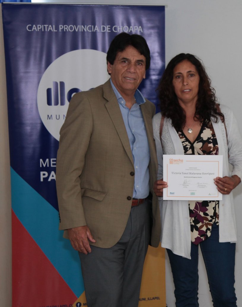
Ceremonia de adjudicación Programa Cosecha 2018

COsecha Potenciando la producción rural del Choapa