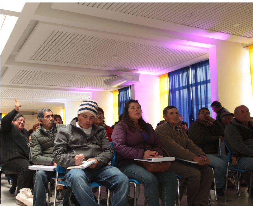
Taller para participantes de Programa Cosecha 2018